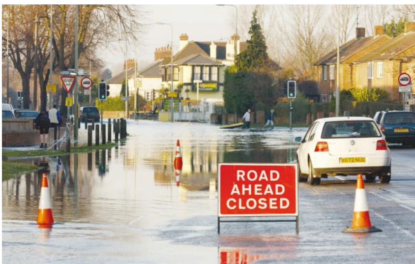
Figure 2 A duck’s delight: widespread flooding in January caused misery in Oxford.